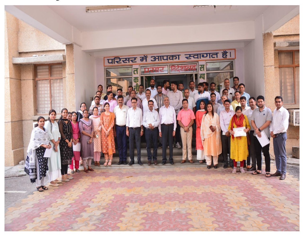
(Group Photograph with Hon'ble VC, Director Extension and SMS, KVK, SVPUAT, Meerut)

Newspapers are attached for ready reference. The photographs showing the view of program from different angle are also attached herewith.