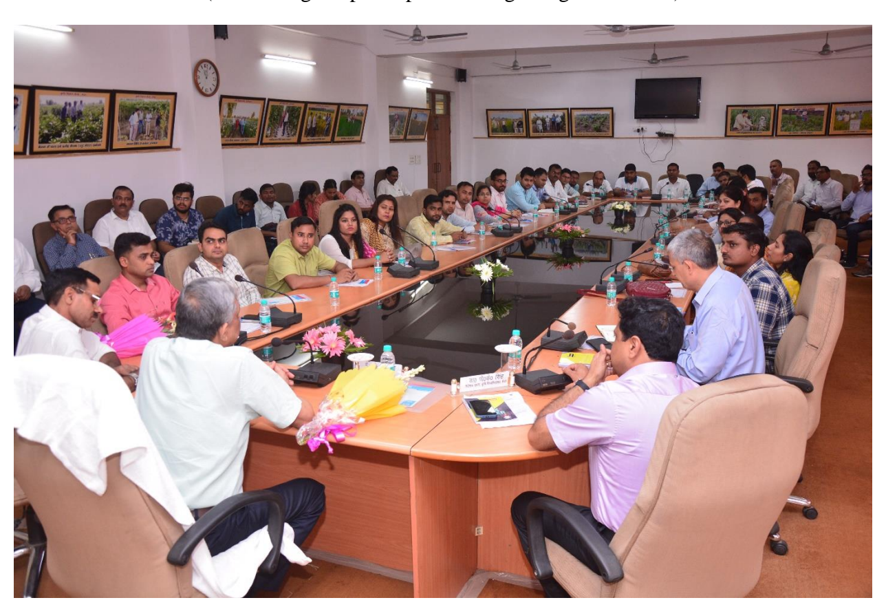
(Inauguration of the program)